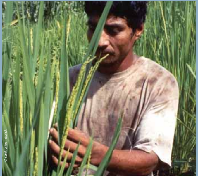
Agriculteur latino-américain dans un champ de maïs.

Au Paraguay, la culture du soja chasse de leurs terres des milliers de petits agriculteurs chaque année. De nombreux témoignages ont confirmé ces dernières années des violations des droits de l'homme et des expulsions de communautés paysannes par les propriétaires des plantations de soja.