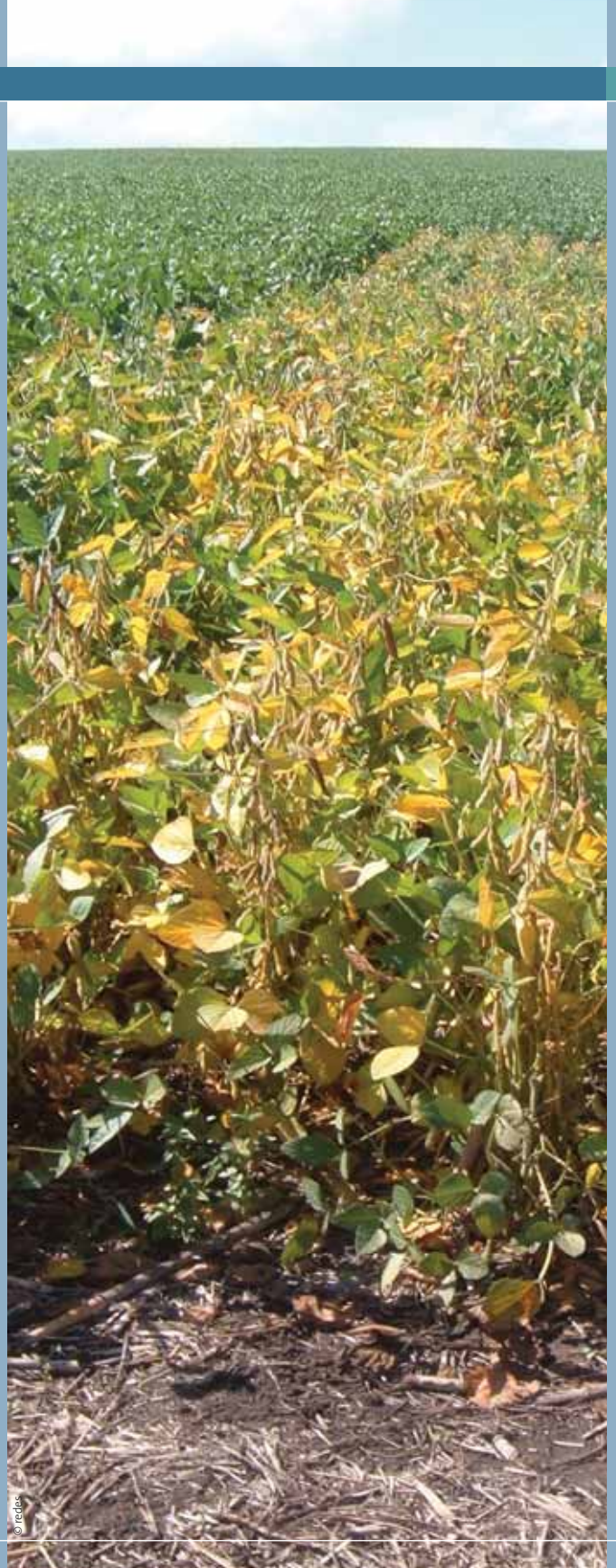
Le soja en Amérique du Sud.

L'introduction des cultures GM a été dominée et promue par une poignée d'entreprises. Trois d'entre elles – Monsanto, Syngenta et Bayer – sont responsables de presque tous les produits agricoles GM que l'on cultive à présent dans le monde.