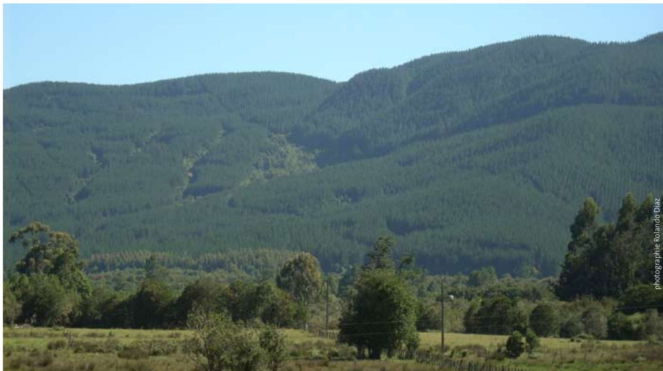
Plantation de Pinus radiata dans la commune de Toltén, Sud du Chili