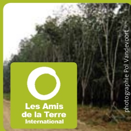
Des hévéas dans une plantation. Beaucoup de plantations d'hévéas servent maintenant à produire de l'huile de palme. Sumatra, Indonésie, 2004