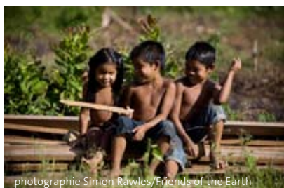
Des enfants de la tribu Makushi s'amuse, forêt d'Iwokrama, Guyana

Le Programme de collaboration sur REDD (UN-REDD) vise aussi à aider les pays à se préparer au système REDD. Les objectifs du projet incluent la comptabilisation du carbone stocké dans les forêts et des questions de propriété et d'occupation des forêts, entre autres choses.