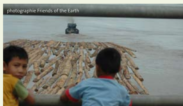
Exploitation du bois, Indonésie