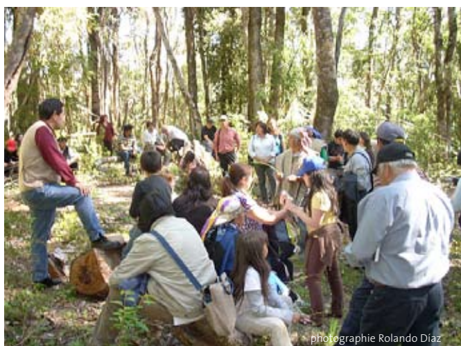
Rencontre 'Jour des forêts', activités d'éducation environnementale dans la forêt selon la culture mapuche. Village 'lof epu rewe', commune de Loncoche, Sud du Chili

Ces discussions apparemment ésotériques sur des nuances linguistiques reflètent des problèmes très réels qui apparaissent sur le terrain autour de REDD. Dans la plupart des cas étudiés dans le présent rapport, les peuples autochtones et autres doivent se battre pour participer aux consultations et à d'autres instances importantes, en dépit du fait que leur participation au système REDD et les bénéfices potentiels qu'ils en tireront aient été largement vantés. Le respect des droits de ces peuples est aussi un élément qui manque dans bien des cas. Les impacts sur leurs sociétés et leurs cultures sont aussi un élément très préoccupant.