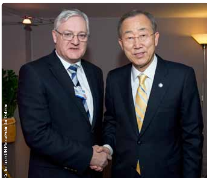
Saludo protocolar del director ejecutivo de Shell Peter Voser y el Secretario General de la ONU Ban Ki-Moon.