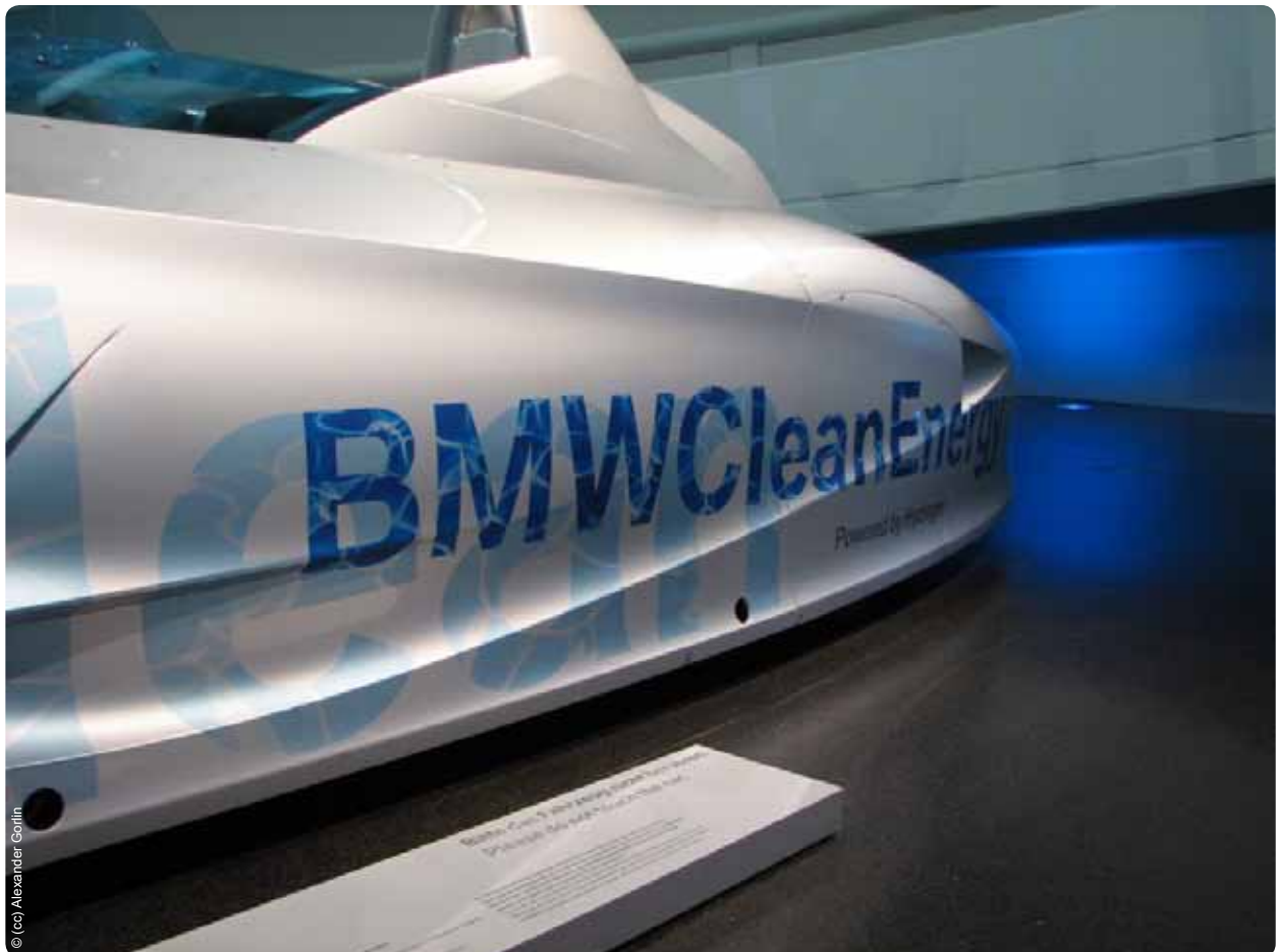
BMW exhibe un prototipo de automóvil a hidrógeno en su propio museo en Múnich, Alemania

empresa de servicios públicos de electricidad de América Latina; Statoil , la empresa de gas y petróleo de Noruega; y Duke Energy , una multinacional estadounidense vinculada fuertemente a la generación a carbón y con operaciones en Estados Unidos, Canadá y América Latina. El director general del Fondo de Desarrollo de la Organización de Países Exportadores de Petróleo (OPEP) también forma parte del grupo, así como Mark Moody-Stuart, Presidente de la Fundación para el Pacto Mundial de la ONU y ex director ejecutivo de la Royal Dutch Shell, y John Browne, ex director ejecutivo de British Petroleum (BP) y actual director de Riverstone Holdings , una empresa privada que se especializa en maximizar el rendimiento de las inversiones en el sector de la energía y la electricidad. Además, el grupo es presidido por Charles Holliday, jefe de DuPont y actual Director Ejecutivo del Bank of America , el tercer