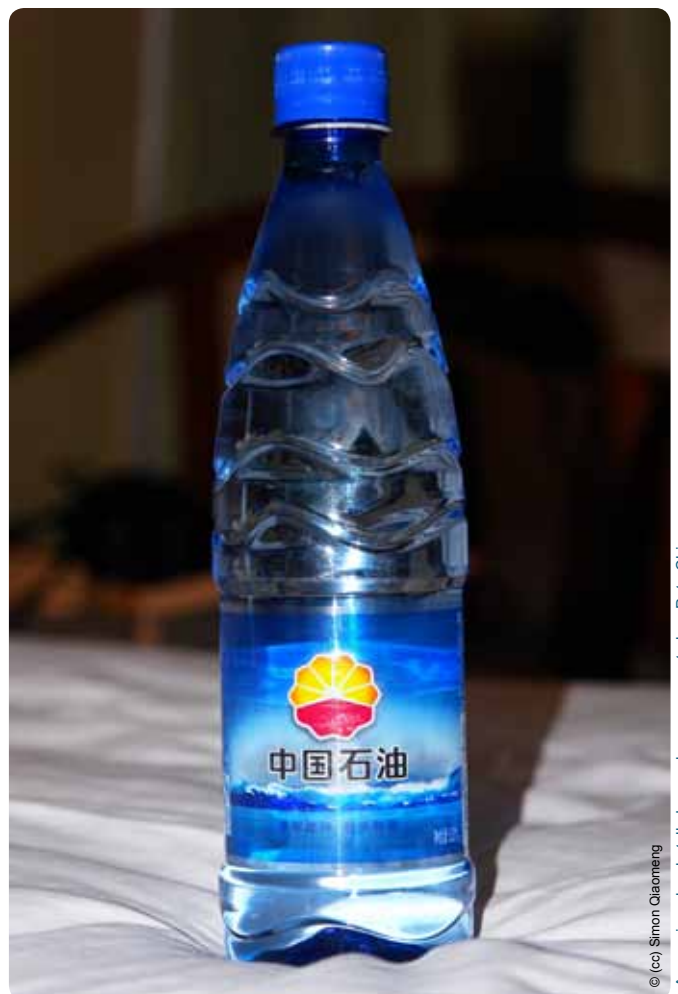
Agua mineral embotellada para la empresa petrolera PetroChina.

La continuación del trabajo del Centro de las Naciones Unidas sobre las Empresas Transnacionales, establecido en 1974, o la creación de una organización similar en la ONU, podría ser uno de los primeros pasos para comenzar a abordar seriamente en el marco de la ONU los impactos de las grandes empresas.