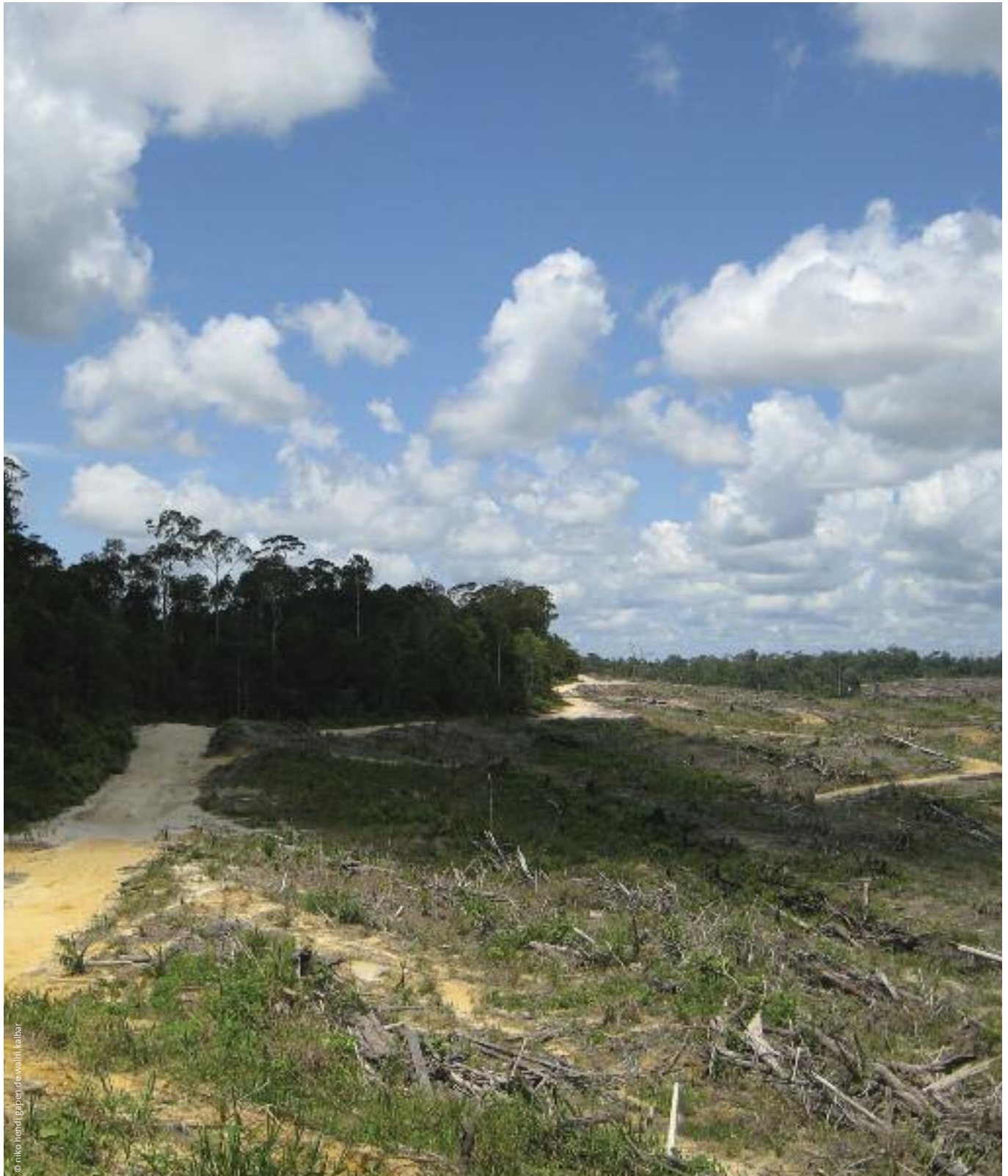
Monocultivo de palma aceitera, Kalimantan Occidental.