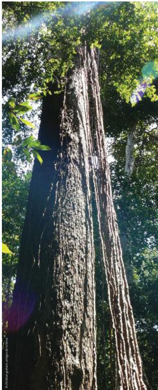
Bosque tropical húmedo en Borneo, Indonesia.

El efecto del cambio climático en el papel que desempeñan los bosques en el ciclo hidrológico sigue siendo incierto en general. Si bien se espera que el propio ciclo hidrológico global se "intensifique", hasta el momento no hay certeza sobre cuáles serán los impactos precisos (Defra/ARIC, 2008). Al aumentar las temperaturas, habrá una tendencia al aumento de las tasas de transpiración de los bosques, pero la sequía, o incluso la disminución de la humedad del suelo, limitará la cantidad de agua disponible para la transferencia. El aumento de los niveles de dióxido de carbono también suprimirá la transpiración provocando el cierre de las estomas de las plantas (Pallas, 1965). Por otra parte, el aumento de las precipitaciones puede además determinar un aumento de las inundaciones fluviales.