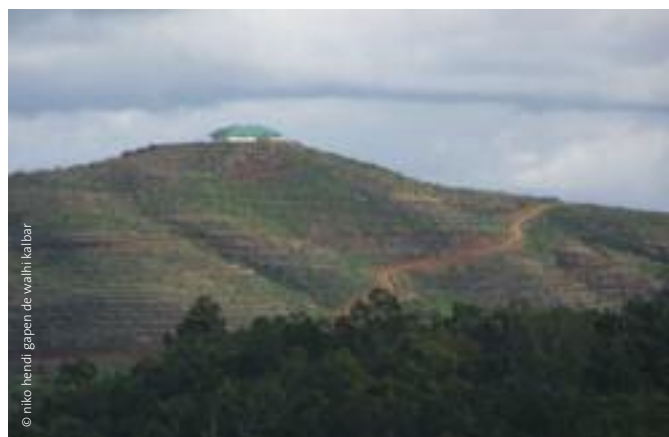
Tierra desmontada, lista para una plantación de árboles de palma aceitera, Kalimantan Occidental.

Los incendios forestales también van en aumento, tanto en términos de frecuencia como de intensidad, con consecuencias desastrosas para la biodiversidad y para el clima mundial: la quema de materia orgánica libera a la atmósfera grandes cantidades de carbono almacenado. El hecho que el cambio climático también esté contribuyendo a un incremento de los incendios forestales es avalado por recientes investigaciones en EE.UU., que demuestran un repentino incremento en la frecuencia y duración de los incendios a mediados de la década de 1980. Esto fue particularmente notorio en las Montañas Rocosas del Norte, donde el cambio en el uso del suelo evidentemente no fue la causa, y en cuyo caso el incremento de los incendios forestales está asociado al aumento de las temperaturas en la primavera y el verano y al derretimiento prematuro de la nieve durante la primavera.