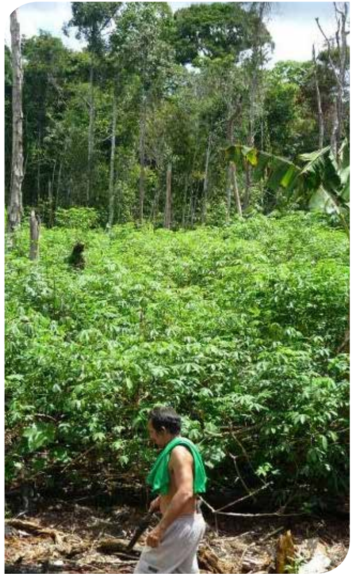
Fotografía: Roza. Cultivo itinerante de yuca (Manihot esculenta) en medio de selva amazónica (Brasil).