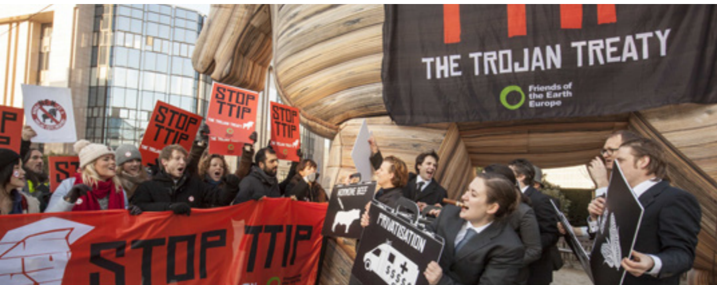
Manifestations à Bruxelles contre le projet d'accord commercial TAFTA/TTIP